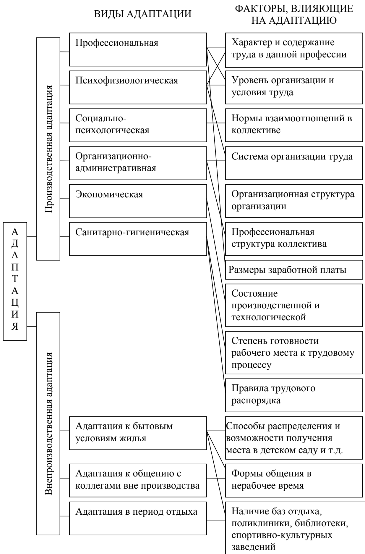
Рисунок 1. Виды адаптации и факторы, на нее влияющие