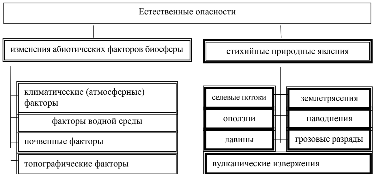
Рисунок 1. Естественные опасности

Ответ: Естественные опасности возникают при изменении абиотических факторов биосферы и при стихийных природных явлениях (рисунок 1).